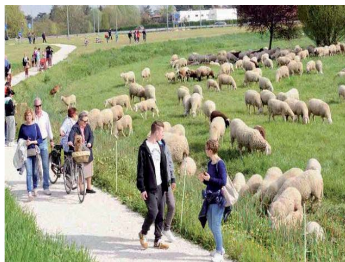
--Pecore in un parco a Ferrara