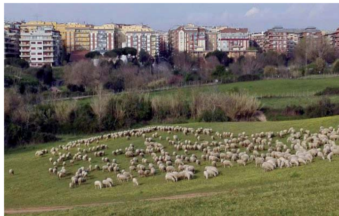
Pecore al parco della Caffarella, Roma

Sarebbe necessario non dimenticarsene, almeno per onestà intellettuale, in special modo quando si critica ogni decisione che viene presa per cercare di arginare lo sfascio della città.